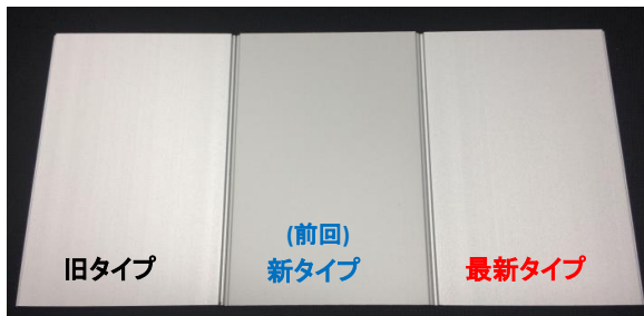
【パネルフレーム(Hフレーム)】